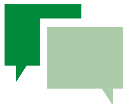
Aanknopingspunten voor gesprek