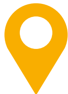
Weten waar je staat

Het Generiek Actieplan geeft aan dat er behoefte is aan sturingsinformatie aangaande de actuele staat van de informatiehuishouding (IHH). Hieraan wordt een dashboard gekoppeld met een tweeledig doel: "Het kan gebruikt worden als sturingsmiddel, om de voortgang te meten. Hiernaast kan het gebruikt worden om binnen de organisatie het gesprek te voeren over de indicatoren en actief verbeteringen vast te stellen."