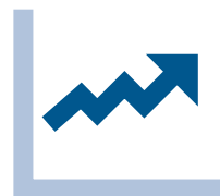
Onderbouwing voor gerichte verbetering